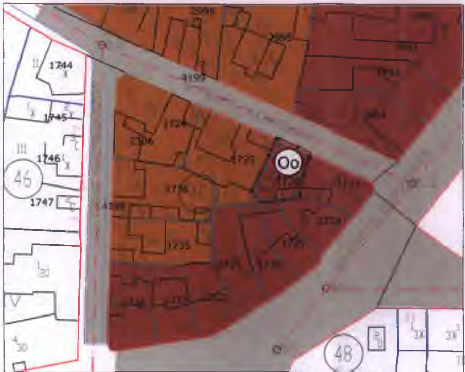
Скица с изменение на ОУПО Севлиево, за ПИ 65927.501.1726, по КККР на гр. Севлиево, общ. Севлиево М 1:1000