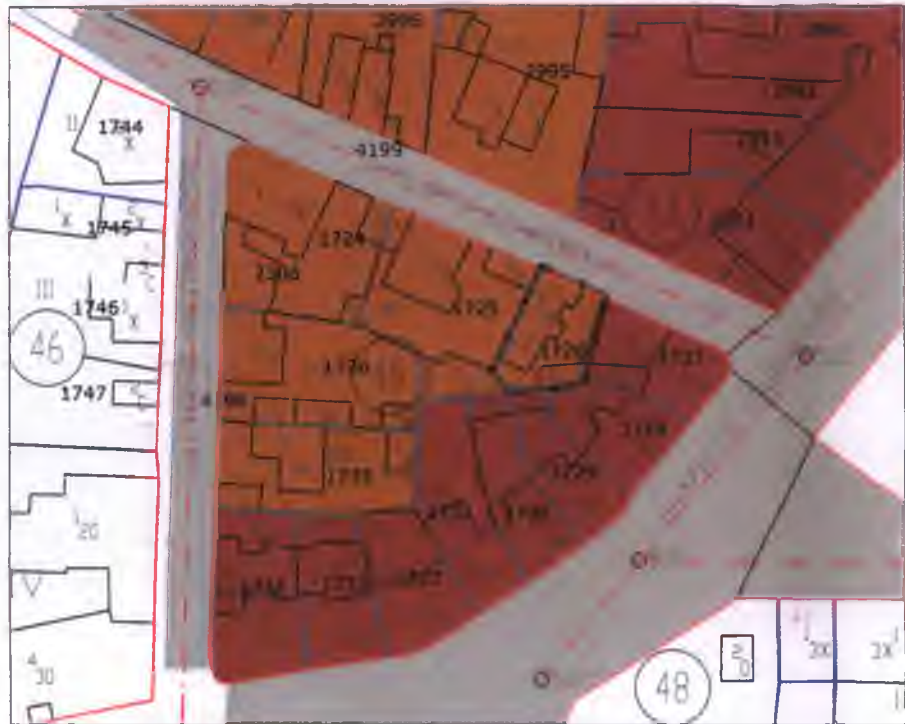
Извадка от действащия ОУПО Севлиево, за ПИ 65927.501.1726, по КККР на гр. Севлиево, общ. Севлиево М 1:1000